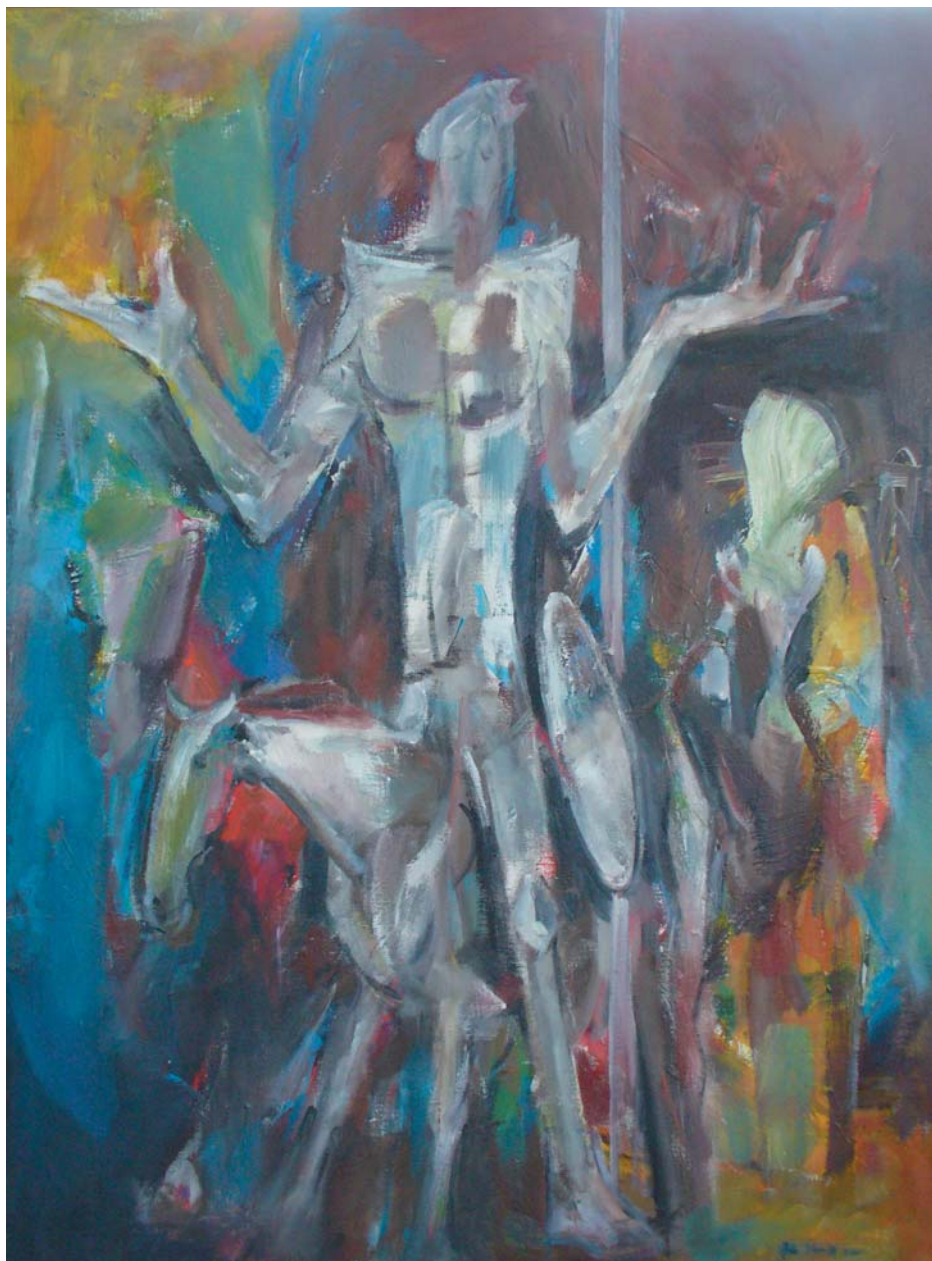
Ján Ilavský, Don Quijote , 1998, olej, 120x90 cm

Identifikačný kód Slovenska III. 16 umelcov Slovenska 16 rokov Slovenska