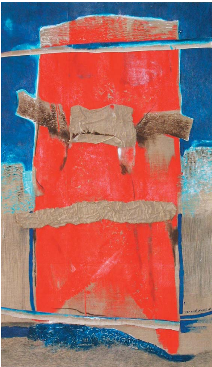
Ivica Krošláková, Erupcia , 2005, akryl, 175x105 cm