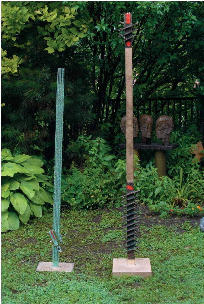
Milán Lukáč, Steblo, bronz, 2007, 160x30x30 cm (vpravo)