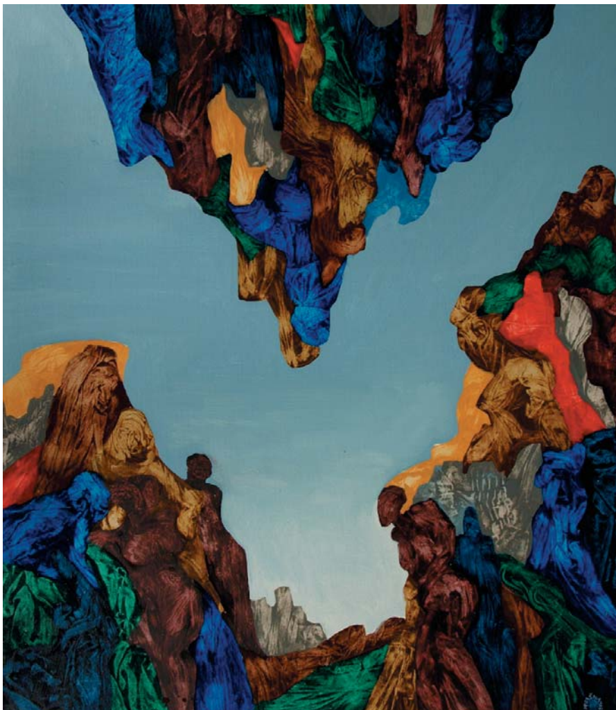
Marián Prešnajder, Fatamorgána , olej, 85x75 cm, 2009

Identification Code of Slovakia III. 16 artists of Slovakia 16 years of Slovakia