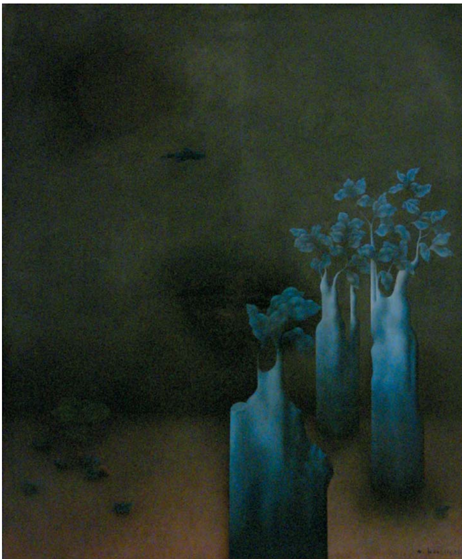
Michal Jakabčič, Nočné ticho, olej, 100x75 cm, 1991