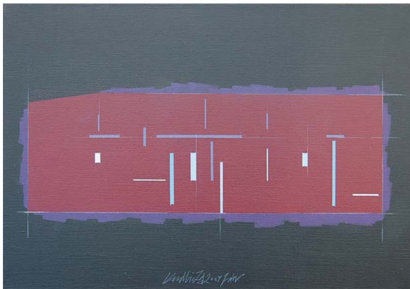
Ján Kudlička, Krajinopartitúra I., 2009, acryl, 35x50cm

Identifikačný kód Slovenska III. 16 umelcov Slovenska 16 rokov Slovenska