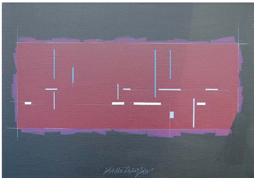
Ján Kudlička, Krajinopartitúra II., 2009, acryl, 35x50cm