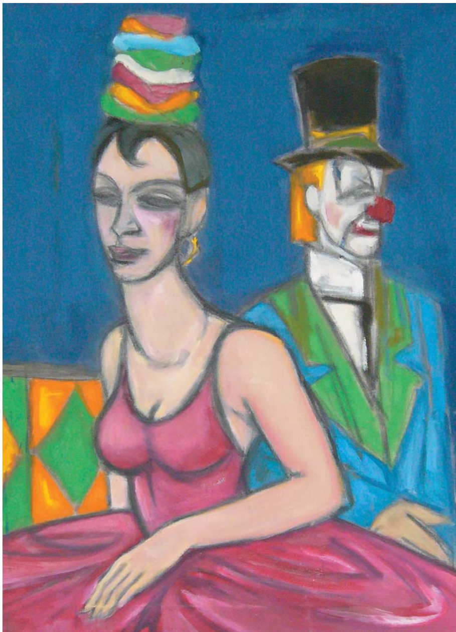
Emil Bačík, Klaun a žena, 1996, olej, 72x56,5 cm