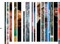
Identifikačný kód Slovenska III. 16 umelcov Slovenska 16 rokov Slovenska

The third annual longlasting project Identification code of Slovakia will bring something new again. The works of the artists that make up the big word CULTURE.