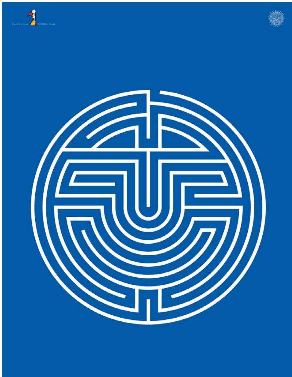
Pavol Rozložník, Značka pre kreatívne štúdio (IQ DESIGN Studio), 1998