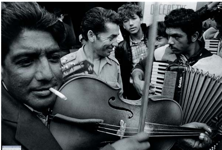
Tibor Huszár, fotografie z cyklu Cigáni: Gypsies III., fotografia, 67x58 cm, 1994 Gypsies II., fotografia, 67x58 cm, 2002